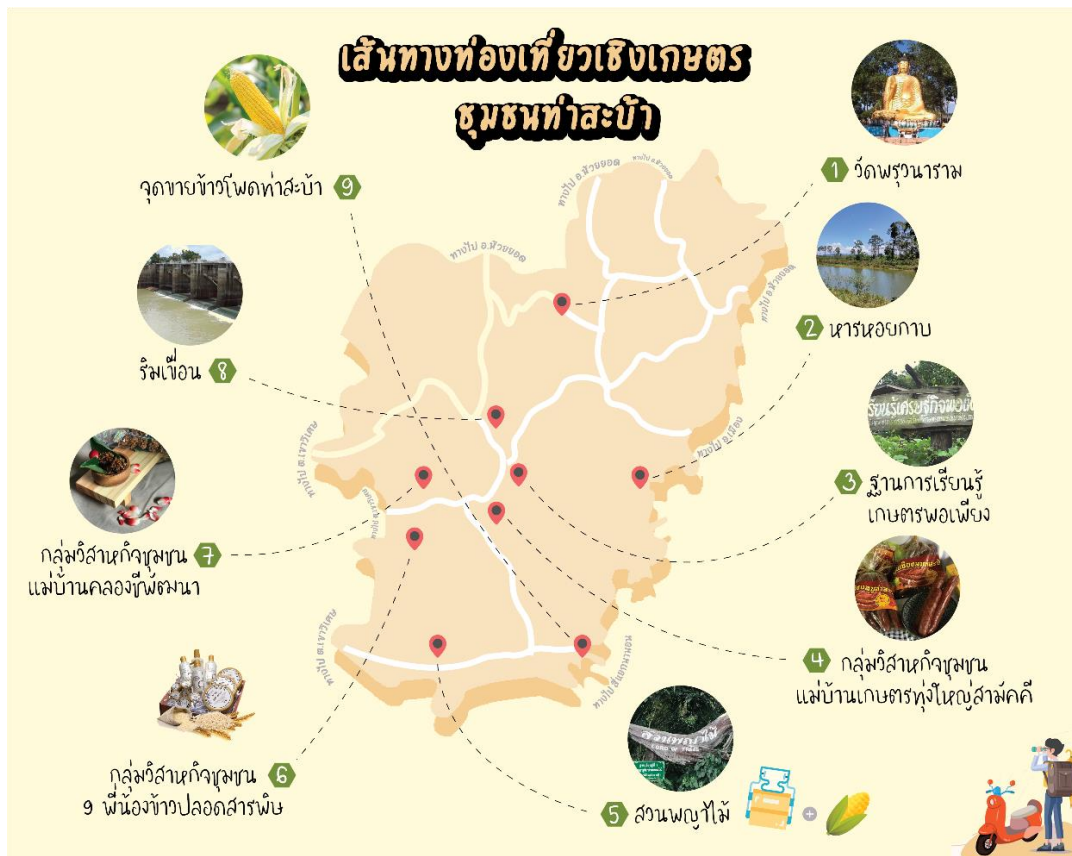
Figure 2 Agro-Tourism Routes based on A Creative Connection with Local Resources in the Tasaba Community